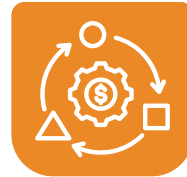
Operational Business Model