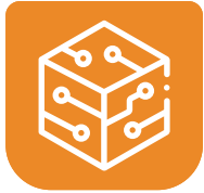
Enterprise Architecture Management